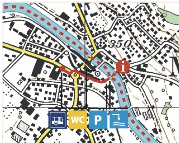
Meeting point in Mellingen

We do not offer shuttles back to Bremgarten, therefore we recommend travelling to and from the river by public transport.