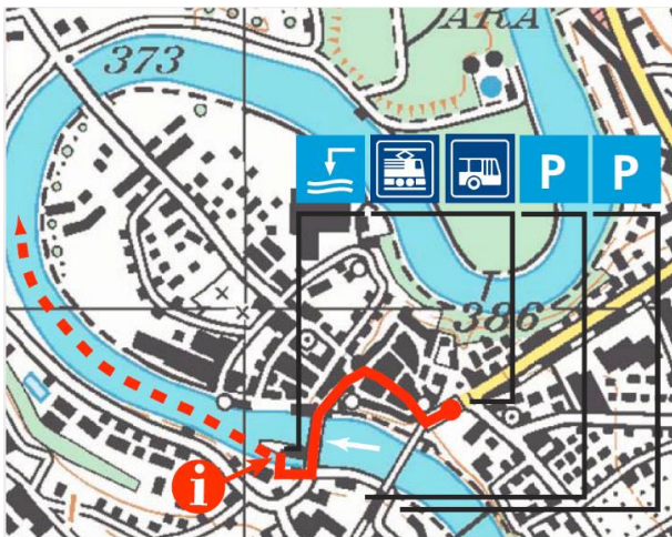
Meeting point in Bremgarten

From the bus stop Niederwil AG, Bremgarten busses go to Bremgarten (travel time approx. 35 min – see www.sbb.ch ).