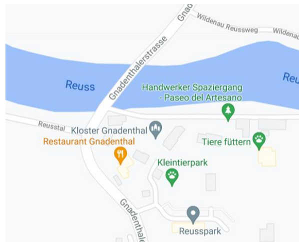
Take-out in Gnadenthal / Stetten