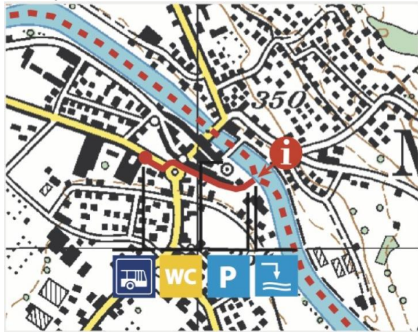
Ausbootstelle in Mellingen